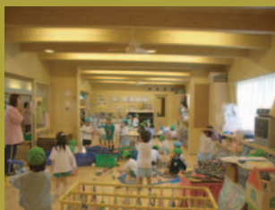
可動間仕切りで仕切られた保育室