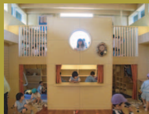
ロフトつきの「絵本の小部屋」

『EDI REPORT』では、竣工物件のプロジェクト概要と、設計・監理時の配慮点などについて 2009.8.10 随時、設計担当者からご報告していきます。