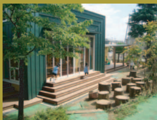
「風の広場」につながる野外交渉