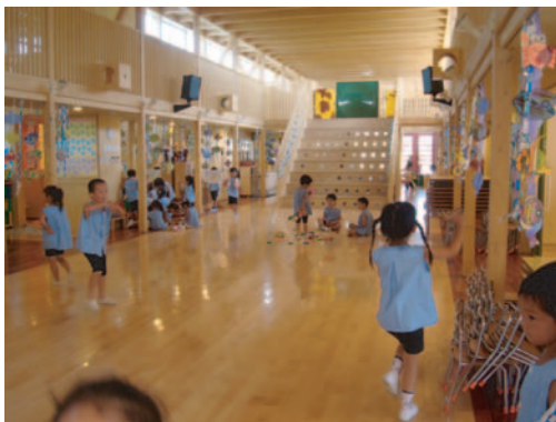
観覧席になる階段遊具がある「風の広場」