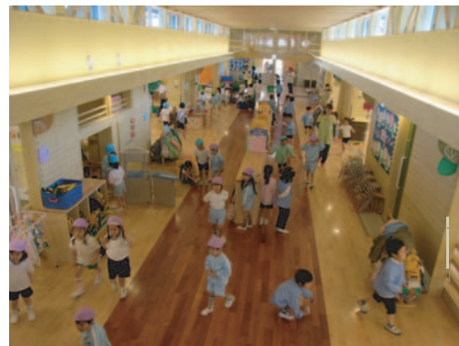
幅5.3メートルのおはなし広場