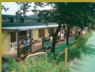
緑に囲まれたデッキテラス